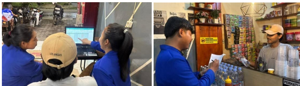
Gambar 3. Pelaksanaan Kegiatan

Pembuatan file Excel untuk pengisian stok bertujuan untuk mempermudah proses pencatatan, pemantauan, dan pengendalian persediaan barang secara sistematis dan akurat. Excel dipilih karena mudah digunakan, fleksibel, serta mampu menampilkan data secara terstruktur. Proses pembuatan dimulai dengan menyusun kolom-kolom utama yang dibutuhkan, seperti kode barang, nama barang, kategori, stok awal, jumlah barang masuk, jumlah barang keluar, dan stok akhir. Selain itu, ditambahkan kolom tanggal dan keterangan untuk mencatat waktu transaksi serta informasi pendukung lainnya. Selanjutnya, diterapkan rumus Excel untuk menghitung stok akhir secara otomatis berdasarkan stok awal, barang masuk, dan barang keluar. Hal ini bertujuan untuk meminimalkan kesalahan perhitungan manual dan meningkatkan efisiensi kerja. Format tabel juga disesuaikan agar mudah dibaca, dengan penggunaan header yang jelas dan penataan data yang rapi. Dengan adanya Excel pengisian stok ini, proses pengelolaan persediaan menjadi lebih terkontrol, data stok dapat diperbarui secara berkala, dan laporan stok dapat dibuat dengan lebih cepat dan akurat. Excel ini diharapkan dapat membantu pengguna dalam pengambilan keputusan terkait kebutuhan pengadaan barang serta mencegah terjadinya kekurangan atau kelebihan stok.