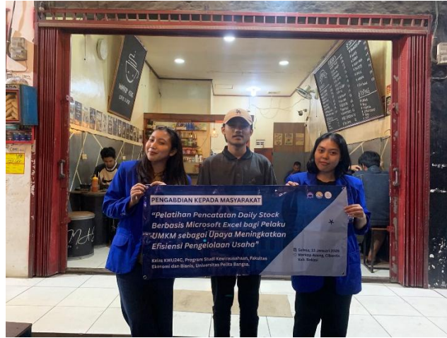
Gambar 4. Foto Bersama Mitra

Microsoft Excel sebagai alat bantu pengelolaan usaha (Syifa et al., 2025). Peserta tidak hanya memahami fungsi dasar Excel, tetapi juga mampu mengaplikasikannya secara langsung sesuai dengan kebutuhan operasional harian usaha. Hal ini terlihat dari kemampuan peserta dalam menginput data, menggunakan tabel, serta melakukan perhitungan stok secara mandiri.