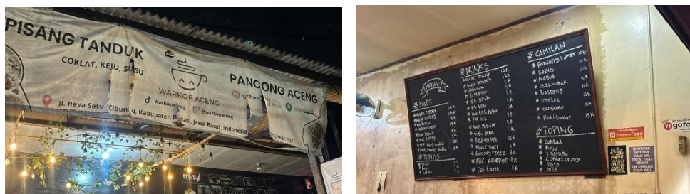
Gambar 1. Survei Mitra dan Survei Kebutuhan