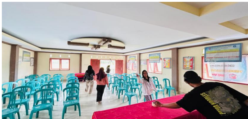
Gambar 1. Persiapan Lokasi Kegiatan PkM