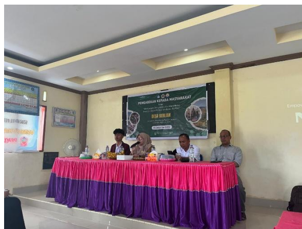
Gambar 2. Sambutan Sekretaris Desa Berlian Kec Tilongkabila Kab. Bone Bolango

Pelaksanaan kegiatan PkM diawali dengan rangkaian pembukaan melalui sambutan dari pihak pemerintah desa yang diwakilkan oleh sekretaris desa Berlian yang menyampaikan ucapan terima kasih atas kesempatan untuk bisa melaksanakan kegiatan ini di desa tersebut dan menyampaikan hal tentang proses pengelolaan BUMDes Berlian Jaya, yang dilanjutkan dengan membuka kegiatan secara resmi.