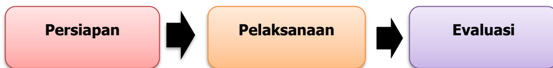
Gambar 2. Tahapan Pelaksanaan Kegiatan

Pelaksanaan kegiatan pengabdian masyarakat yang dilaksanakan di beberapa Lembaga Pendidikan setingkat SMA/SMK/ MATiga mitra Lembaga Pendidikan Sekolah Menengan Atas (SMA) kecamatan Paciran, dengan dibagi 5 kelompok kerja dan tiap kelompok memiliki tema yang berbeda, yang meliputi 3 lembaga, untuk kelompok ini, dengan tema, "Membangun Jiwa Entrepreneur Muda Melalui Pelatihan Berbasis Nilai-Nilai Islam". Pelaksanaan kegiatan dalam bentuk sosialisasi dan pelatihan, dengan sasaran yang di tuju adalah calon lulusan setingkat Sekolah Menengah Atas (SMA). Adapun pelaksanaan pengabdian ini dilakukan serentak di beberapa lembaga pendidikan pada tanggal 1 Februari 2026 dengan jumlah peserta 650 (Enam ratus li puluh) peserta yang dibagi menjadi 5 kelompok, dan kelompok yang 1 (satu), jumlah peserta 110 (seratus sepuluh) peserta. pada kelompok 1 (satu), pelaksanaan kegiatan ini di SMAMuhammadiyah 2, SMK TI Muhammadiyah 11 dan Madrasah Aliyah Muhammadiyah 5 Paciran Lamongan. Agar kegiatan ini berjalan dengan maksimal, maka metode pelaksanaan kegiatan ini digunakan dalam tiga tahap. lebih jelasnya dapat dilihat melalui gambar berikut ini;