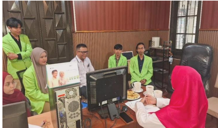
Gambar 1. Penyerahan oleh pembimbing magang

Tahap pelaksanaan merupakan inti dari kegiatan magang. Pada tahap ini mahasiswa terlibat secara langsung dalam berbagai kegiatan operasional kantor, antara lain penginputan SPT 1770, pembuatan laporan triwulan, rekapitulasi kas mall 2025, pengelolaan data penginputan SPT, pengolahan data koperasi batik, serta penginputan invoice PPN 2025 ke dalam aplikasi QuickBooks . Keterlibatan langsung ini memberikan pengalaman praktis yang komprehensif dalam bidang perpajakan dan akuntansi keuangan berbasis teknologi (Sari, Manafe, dan Elisabeth 2026).