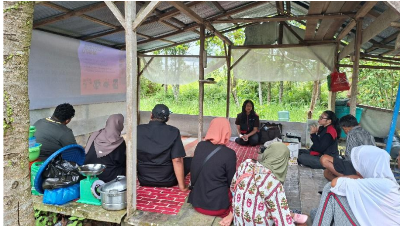
Gambar 2. Kegiatan penyampaian materi oleh tim

pemanfaatan sumber daya lokal sebagai bahan baku pakan alternatif. Penjelasan juga diberikan mengenai kandungan protein pada bahan baku pakan yang berpengaruh terhadap pertumbuhan ikan, termasuk pemanfaatan tepung ikan yang berasal dari ikan hasil tangkapan sampingan atau ikan yang memiliki nilai jual rendah (Risa & Isma, 2023).