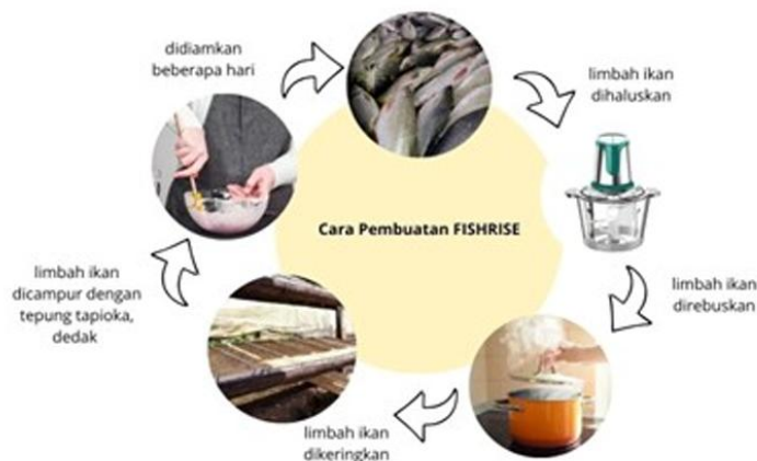
Gambar 3. Proses Pembuatan Pakan Ikan

Selain membahas aspek teknis pembuatan pakan, peserta juga diberikan pemahaman mengenai pentingnya keseimbangan komposisi nutrisi dalam formulasi pakan. Diskusi difokuskan pada kebutuhan protein, karbohidrat, lemak, vitamin, dan mineral yang harus disesuaikan dengan jenis, ukuran, serta fase pertumbuhan ikan. Berdasarkan literatur, komposisi nutrisi pakan umumnya terdiri atas protein sebesar 20–60%, karbohidrat 20–30%, lemak 4–18%, serta vitamin dan mineral sebesar 2–5% (Eka, 2024). Informasi tersebut menjadi salah satu topik yang paling banyak menarik perhatian peserta. Hal ini terlihat dari tingginya partisipasi dalam sesi diskusi, terutama terkait penentuan komposisi bahan baku yang mampu menghasilkan pakan dengan kandungan gizi yang sesuai namun tetap ekonomis.