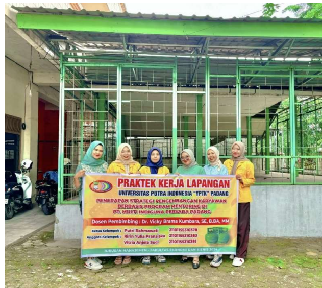
Gambar 2. Dokumentasi Kegiatan di PT. Multi Indiguna Persada