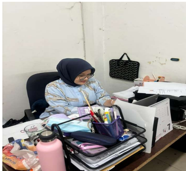
Gambar 3. Dokumentasi Kegiatan di PT. Multi Indiguna Persada