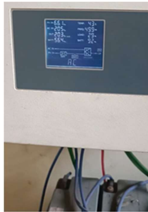
Gambar 1. Pengambilan data PLTS

Sementara itu spesifikasi pompa yang digunakan adalah sebagai berikut :