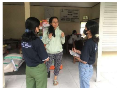
Gambar 2. Wawancara pengelola BUMDes

Pada tahap kedua, tim PkM melakukan pelatihan cara pencatatan transaksi yang benar menggunakan aplikasi microsoft excel. Penggunaan aplikasi excel memberikan kemudahan bagi pengelola BUMDes dalam menyusun laporan keuangan serta mudah dipahami pembaca oleh pengguna laporan keuangan (Hidayati et al., 2024; Ogearti, 2020; Suci et al., 2021). Selain itu, perangkat microsoft excel mudah diperoleh dan tidak membutuhkan biaya terlalu tinggi (Kusumawati et al., 2023). Berbagai kemudahan ini membantu pengelola BUMDes dalam penyajian laporan keuangan. Kegiatan pelatihan ini bertujuan untuk meningkatkan kompetensi karyawan BUMDes dalam mencatat