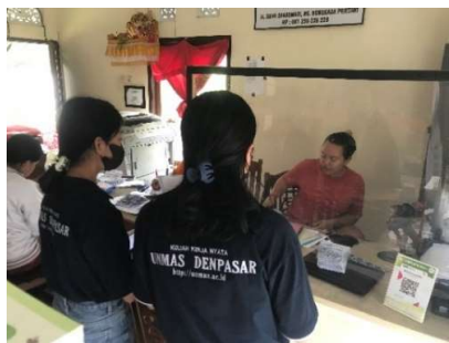
Gambar 1. Observasi ke BUMDes

Pada kegiatan pengabdian ini, tim PkM melakukan beberapa tahapan. Tahap pertama diawali dengan observasi dan wawancara kepada pengelola BUMDes, yang ditunjukkan pada Gambar 1. Pada tahap ini, tim PkM mencari informasi, menggali permasalahan-permasalahan yang dihadapi pengelola BUMDes, serta mengidentifikasi permasalahan yang menjadi prioritas untuk diselesaikan dalam kegiatan pengabdian ini.