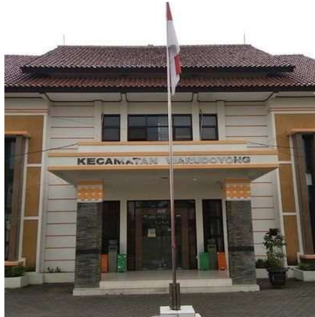
Gambar 2. Lokasi Mitra