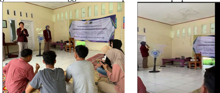
Gambar 2. kegiatan Pendidikan

Pelatihan pendidikan bahasa internasional di berikan kepada para remaja yang ada di Desa Balonggandu. Pelatihan dilaksanakan di Aula Desa Balonggandu, jumlah peserta yang hadir 20 orang remaja dan karang taruna Desa Balonggandu. Materi pelatihan berupa pemahaman vocabulary.