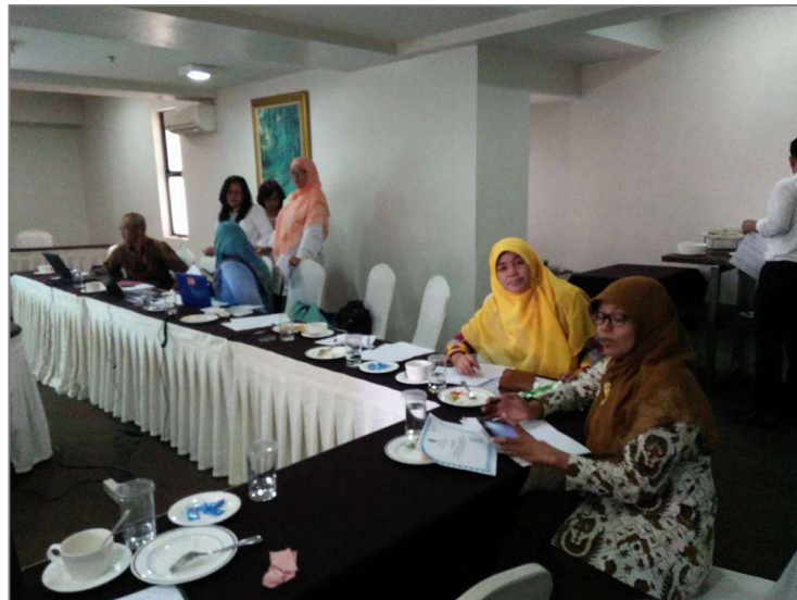
Gambar 3. Pelatihan dan Pendampingan Guru dan Staf Sekolah

Selain itu, keberhasilan program ini juga dapat dilihat dari perubahan paradigma dalam promosi sekolah yang dilakukan oleh TK Kupu-Kupu Mungil. Dengan beralih dari metode promosi konvensional ke pendekatan digital, sekolah berhasil mengatasi beberapa tantangan yang dihadapi sebelumnya, seperti keterbatasan jangkauan dan biaya promosi yang tinggi. Hal ini menunjukkan bahwa pembangunan website telah membuka pintu untuk kemungkinan-kemungkinan baru dalam upaya promosi sekolah yang lebih efektif dan efisien. Gedung sekolah Kupu-kupu Mungil diperlihatkan pada Gambar 2. Foto dokumentasi kegiatan pelatihan dan pendampingan terdapat di Gambar 3. Sedangkan Gambar 4 merupakan tampilan dari website kupukupumungil.sch.id.