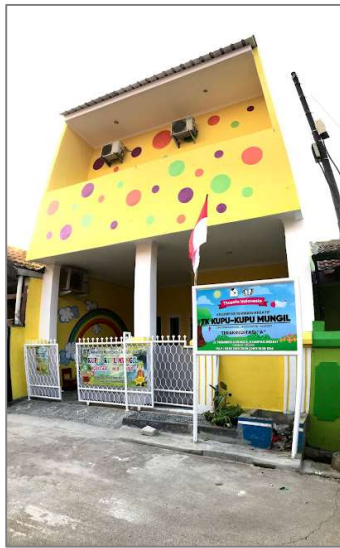
Gambar 2. Sekolah Kupu-kupu Mungil